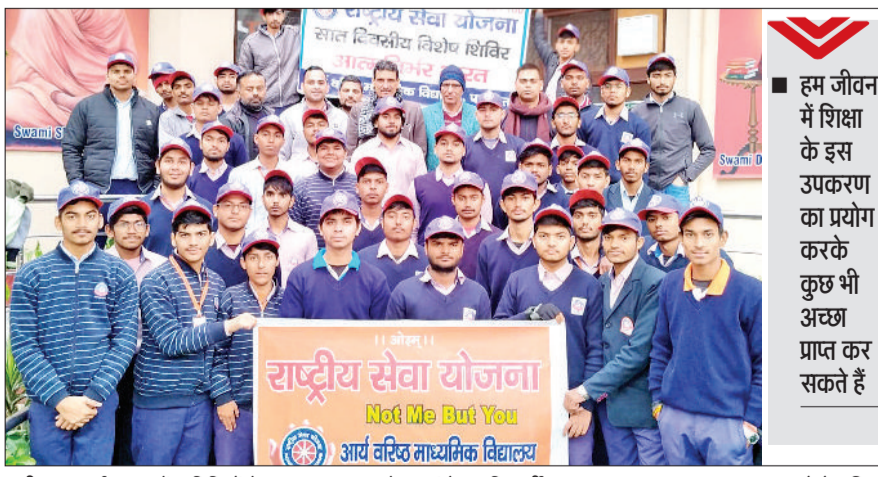
पानीपत। आर्य स्कूल में अतिथियों के साथ एनएसएस के स्वयंसेवक विद्यार्थी।