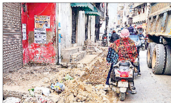
अंबाला। खस्ताहाल सड़क का दृश्य।