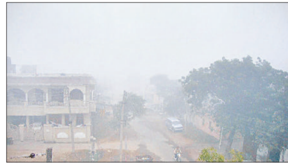
यमुनानगर में शनिवार को आसमान में छाप हुए धुंध के बादल व सुबह के वक्त सड़कों पर घना कोहरा होने पर लाइटें जलाकर गंतव्य पर जाते वाहन चालक।

पिछले आठ दिन से जिले में कड़ाके की ठंड पड़ रही है। आलम यह है कि सुबह के वक्त जहां घना कोहरा छाया रहता है, वहीं, दिन भर आसमान में धुंध के बादल छाए रहने और शीतलहर चलने से लोगों के कामधंधे चौपट हो गए हैं। शनिवार को भी जिले में शीतलहर का कहर जारी