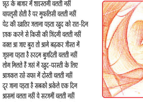
भाव श्रद्धा का न हो तो बंदगी किस काम की आस्था के नाम पर दीवानगी चलती नहीं सहना पड़ता है वमन का दर्द गुल के वारसे सिर्फ लफफाजी से 'नवरंग' शायरी चलती नहीं

झूठ के बाजार में शाइस्तगी चलती नहीं वापसी होती है पर मुफ्तीसही चलती नहीं पेट की खरिद जलाना पड़ता खुद को रात-दिन इश्क करने से किसी की मिंदगी चलती नहीं वक्त आ जाते बुरा तो आगे बढ़कर ग्रीस में जुझना पड़ता है रहरत बुझादिली चलती नहीं लोग मिलते हैं जहाँ में खुद-परस्ती के लिए श्राजकल राते दफान में दोस्ती चलती नहीं दूर जाना पड़ता है सबको श्रंकेते एक दिन आसमां चलता नहीं ये सरजमीं चलती नहीं शौक से जलता है परवाना शमा के सामने बेखुदी के राल में श्रावारीय चलती नहीं रंग वो ही पालते हैं, गिनके बन में खोटे हे हो खुदुसे दिल अग्र तो दुख्खनी चलती नहीं