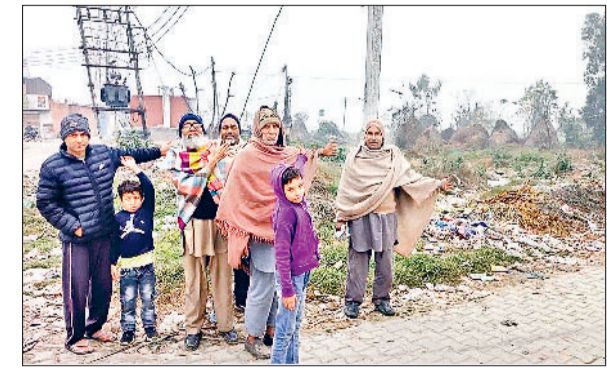
यमुनानगर के गांव जटलाना में जोहड़ के पास पड़ी गंदगी दिखाते ग्रामीण।

गांव जटलाना की हरिजन बस्ती के पास बने जोहड़ में भरा गंदा पानी बीमारियों को निमंत्रण दे रहा है। जिससे ग्रामीणों को भारी परेशानी का सामना करना पड़ रहा है। आए दिन ग्रामीणों को जोहड़ के पास से गुजरना पड़ता है। जिससे गंदे पानी की बदबू व कूड़े के ढेर से ग्रामीणों के लिए परेशानी का कारण बने हुए हैं। ग्रामीणों ने जोहड़ को साफ सफाई करवाए जाने की मांग की।