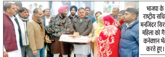
उपस्थित जन समूह को संबोधित करते हुए कही। उन्होंने इस मौके पर विभिन्न विभागों द्वारा लगाई गई