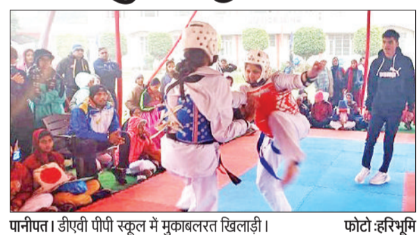
पानीपत। डीवीपी पीपी स्कूल में मुकाबलरत खिलाड़ी।

नुलाई-गुड़ाई व सफाई की गई। प्रो. दलजीत ने विद्यार्थियों को जैविक पौधों की जानकारी देने के साथ कि औषधीय गुणों की जानकारी देते हुए कहा कि इको क्लब के अंतर्गत हमारा उद्देश्य महाविद्यालय के विद्यार्थियों को पर्यावरण संरक्षण के प्रति जागरूक करके जागरूक पर्यावरण प्रहरी बनाना है। इको क्लब के अंतर्गत अनेक विद्यार्थी महाविद्यालय में शिक्षा के साथ - साथ पर्यावरण संरक्षण के कामों में लगातार रुचि लेते हैं। विद्यार्थियों का आह्वान किया कि ऐसे अच्छे अभियानों से सीख लेते हुए अपने महाविद्यालय व पानीपत जिले को सुंदर व साफ बनाया है।