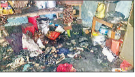
घर में जले सामान का दृश्य व मोटरसाइकिल का पेट्रोल चेक करते हुए।

धनौरा के एक बंद पड़े घर में घुस कर चोरों ने करीब 18 तोले सोना व 3.90 लाख रुपये चुरा लिए। चोर जाते समय घर में आग लगा गए। इससे हजारों रुपये का सा मा न जलकर राख हो गया। रात को करीब डेढ़