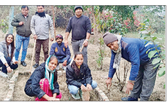
पानीपत। राजकीय कॉलेज में हर्बल गार्ड की सफाई करते टीचर्स व विद्यार्थी।